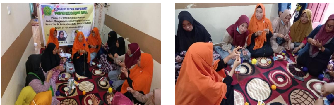
Figure 2. Pembekalan dan praktik teknik merajut

Pelatihan keterampilan merajut ini dilaksanakan pada tanggal 05 - 06 November 2022. Pelatihan ini diikuti oleh 15 orang ibu-ibu dari RW 5 dan RW 6 kelurahan Batu Besar Batam. Pelatihan dimulai dengan memberikan pembekalan oleh tim pengabdian kepada ibu-ibu yang ikut terlibat dalam kegiatan pelatihan. Pembekalan meliputi pemberian materi dan praktik merajut. Metode yang digunakan dalam penyampaian materi dengan cara ceramah dan demonstrasi.