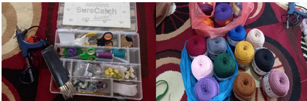
Figure 3. Alat dan Bahan Rajut

Selain memberikan pelatihan dengan cara praktek langsung, pelatih juga menggunakan media video yang berisi tutorial untuk memberikan contoh bagaimana teknik pembuatan benda-benda, sehingga peserta dapat berlatih sendiri dirumah menggunakan video tersebut. Dengan memberikan video tutorial ini peserta lebih mudah meniru proses merajut, video bisa diputar ulang ketika kesulitan mengikuti prosesnya atau tidak sengaja membuat kesalahan.