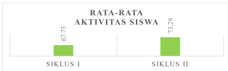
Gambar 3. Perbandingan Aktivitas Siswa (Tingkat Keberhasilan Indikator 2)