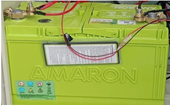
Gambar 6. Baterai Amaron