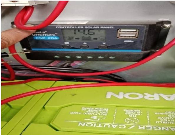
Gambar 10. Pengujian SCC