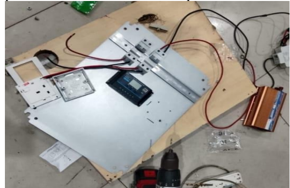
Gambar 8. Panel

sistem untuk memastikan kemudahan pemeliharaan serta keamanan operasional.