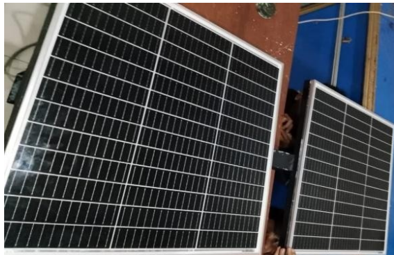
Gambar 3. Solar cell 100Wp

Panel surya berfungsi mengonversi energi cahaya matahari menjadi energi listrik arus searah (DC). Panel surya merupakan sumber daya utama dalam sistem Pembangkit Listrik Tenaga Surya (PLTS) dan berperan penting dalam mengurangi ketergantungan terhadap pasokan listrik dari jaringan PLN. Penggunaan panel surya juga memberikan keuntungan berupa sumber energi yang ramah lingkungan, bebas emisi, serta cocok untuk sistem mandiri (off-grid) yang tidak terhubung ke jaringan listrik umum.