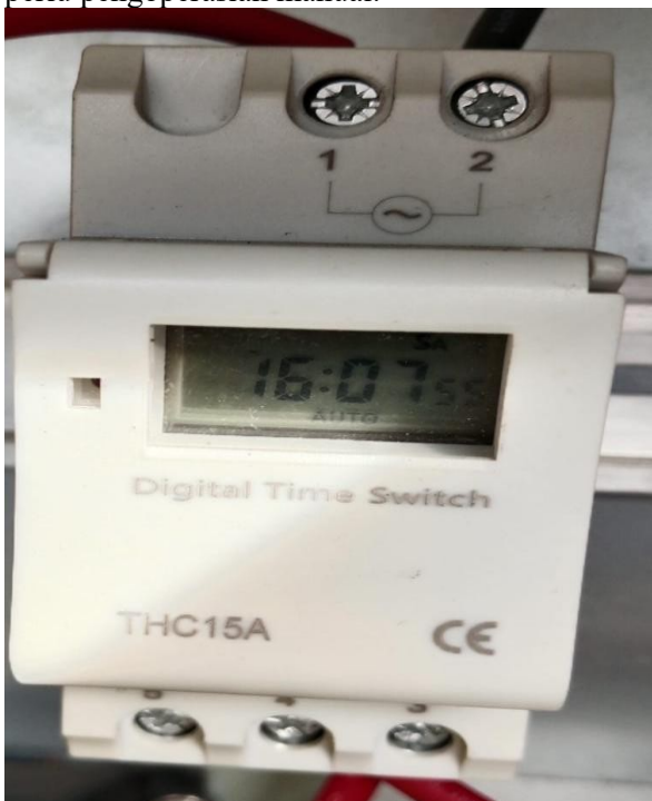
Gambar 7. Timer TCH-15A

Timer TCH-15A berfungsi sebagai pengatur waktu otomatis untuk menyalakan dan mematikan lampu penerangan jalan sesuai jadwal yang telah ditentukan. Dengan penggunaan timer, sistem menjadi lebih efisien karena lampu hanya menyala pada waktu yang dibutuhkan, misalnya pada malam hari, tanpa perlu pengoperasian manual.