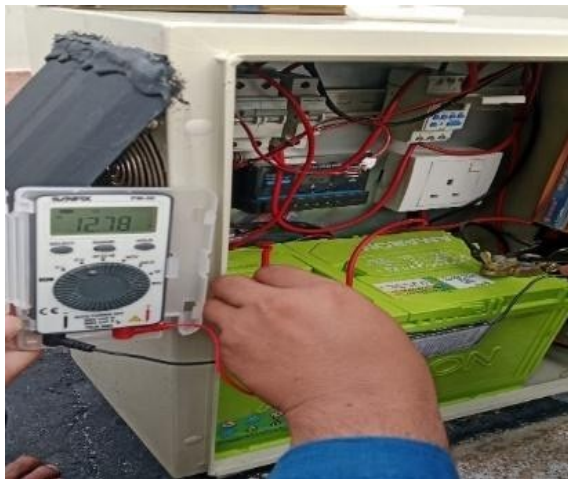
Gambar 12. Penerapan pada baterai