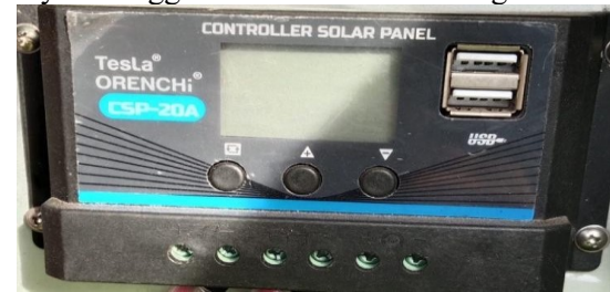
Gambar 4. Solar charge controller

mengoptimalkan daya yang dihasilkan panel surya sehingga efisiensi sistem meningkat.