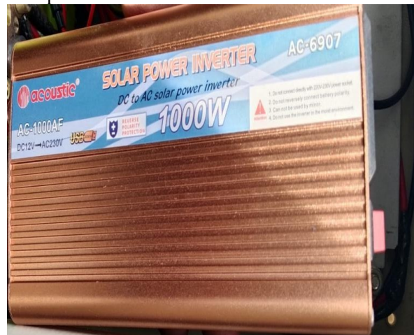
Gambar 5. Inverter

Inverter berfungsi mengonversi listrik DC yang berasal dari baterai menjadi listrik AC yang dapat digunakan oleh beban seperti lampu penerangan jalan. Selain fungsi konversi, inverter juga berperan menjaga kestabilan tegangan keluaran serta melindungi sistem dari kondisi berbahaya seperti kelebihan beban, tegangan rendah, suhu berlebih, dan hubungan arus pendek.