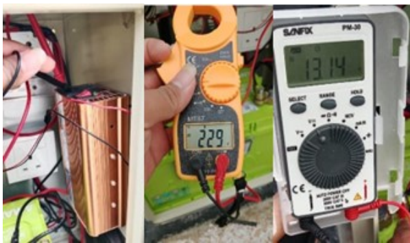
Gambar 11. Mengukur tegangan output dan input inverter