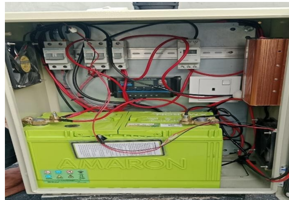
Gambar 9. Wiring

Wiring dilakukan dengan menghubungkan seluruh komponen sesuai jalur yang telah direncanakan. Setiap sambungan diperiksa untuk memastikan koneksi kuat, aman, dan sesuai standar kelistrikan.