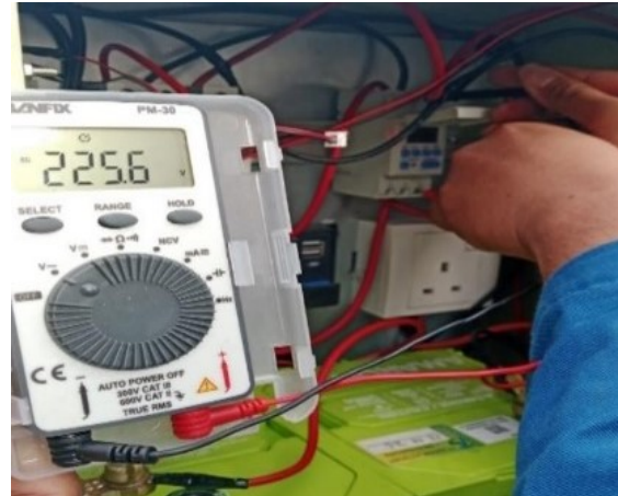
Gambar 13. Penerapan pada Timer Tch15A